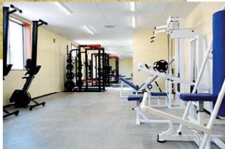
トレーニング室 (第2グラウンド内)