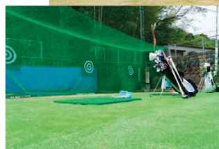
ゴルフ練習場 (第2グラウンド内)