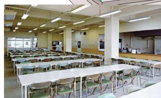
生徒に人気♪メニュー豊富な食堂 100席以上の食事スペースを確保