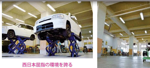
西日本屈指の環境を誇る 自動車工学科実習室