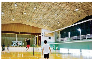
LEDライトを照明に利用 環境に配慮した体育館