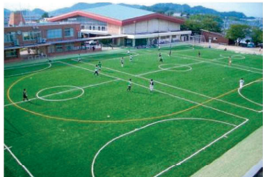
クラスマッチなどを行う 人工芝の第1グラウンド