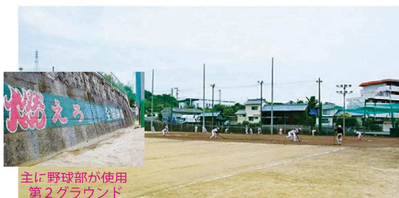
主に野球部が使用 第2グラウンド